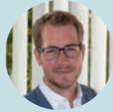
Grußwort des Schulleiters