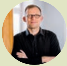
Grußwort des Oberbürgermeisters der Stadt Vaihingen an der Enz